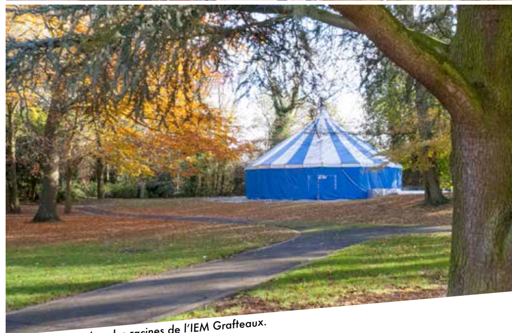
Le cirque inscrit dans les racines de l'IEM Grafteaux.