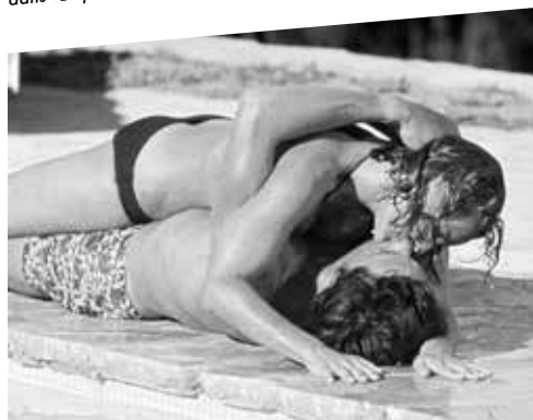
En bas à droite : Romy Schneider, Alain Delon dans «La piscine»

Se regarder se sentir bien dans le regard de l'autre s'embrasser rougir et transpirer vouloir être tout le temps ensemble se questionner douter de ses émotions