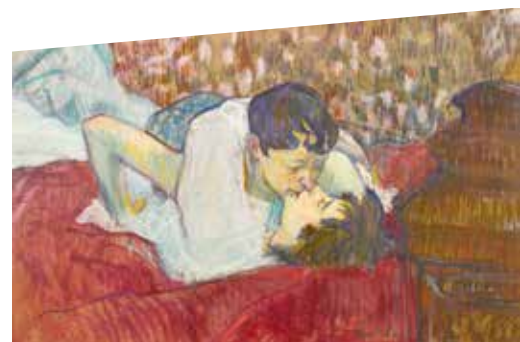
En bas à gauche : «Au lit, le baiser» de Henri Toulouse-Lautrec. Collection particulière.

Au programme rencontre avec des spécialistes, des échanges avec des anciens de l'iem, des films suivis de débats, des interventions d'artistes et du lobbying car on a tous le droit d'aimer et d'être aimé(e) !